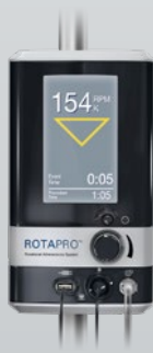
販売名：ロータプレーターPRO 医療機器承認番号：23000BZX00060000